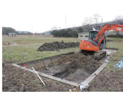
写真2：掘削深度が深い場合