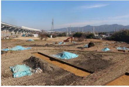
写真1：掘削深度が浅い場合