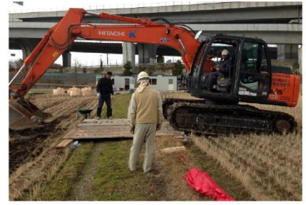
写真3：重機走行時の養生(鉄板)