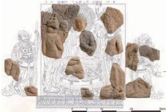
講堂近辺で出土した大型多尊博仏