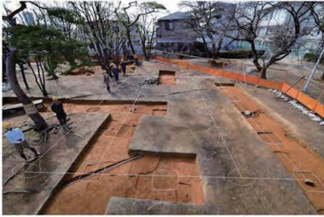
西北院の掘立柱建物検出状況(東から)