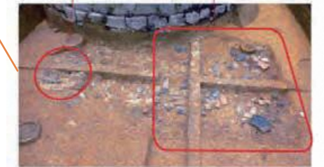
東北院で検出された鑄造遺構(東から)