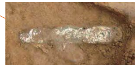
東南院で出土した金銅製飾金具