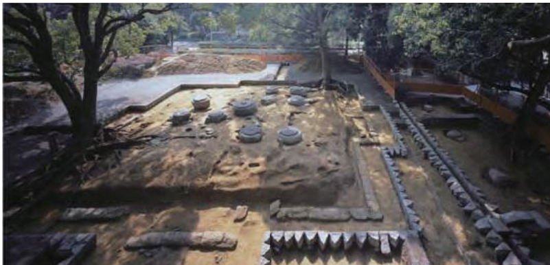
西塔検出状況(北から)

く く だら だら で で ら 特別史跡百濟寺跡では、平成17年度より9ヵ年かけて発掘調査を実施しました。 その結果、一辺約140mで四辺を囲む外郭築地の中に、主要堂塔の他にもいくつかの 建物が建ち、「付 ふ 属 ぞく 院 いん 地」と呼ばれる寺院を管理運営する施設が築地等で囲まれた区画に 分かれて配置されていたことがわかりました。