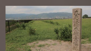
楠葉台場跡(国史跡) 江戸幕府が京都防衛のため勝海舟を設計総責任者として築造した。砲台を持つ要塞跡。全国唯一の河川に面した台場。