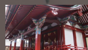
片埜神社本殿(重要文化財) 慶長7(1602)年に豊臣秀頼が片桐且元を総奉行に再建。桃山時代の華麗な様式をよく示しています。