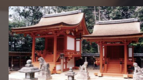
交野天神社本殿・交野天神社末社八幡社本殿(重要文化財) 一間社流造、檜皮葺。室町時代中期に遡る枚方市内の古建築としては最古。