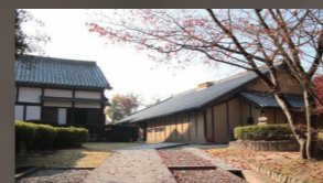
旧田中家 鋳物民俗資料館 江戸時代に鍋・釜などの日用品や梵鐘などを鋳造していた田中家の鋳物工場と主屋を移築・復原し昭和59年オープン。