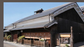
枚方宿鍵屋資料館 江戸時代、枚方宿の代表的な船待ちの宿だった主屋と昭和初期の別棟を整備し、平成13年オープン。