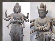
尊延寺 木造降三世軍荼利明王立像(重要文化財) 平安時代後期(11世紀前半)頃。