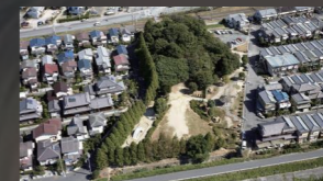
禁野車塚古墳(国史跡) 4世紀前半築造と考えられる全長120mの前方後円墳。

「百済王(くだらのこにぎし)氏」とは、7世紀に滅びた朝鮮半島の古代国家・百済国の王の末裔のこと。その子孫、百済王敬福 きょうふく は、東大寺の大仏造立に際し黄金900両を聖武天皇に献上した功績から上流貴族の位を与えられました。一族は8世紀半ばに枚方の中宮に移り住んで栄え、「百済寺」を創建したと考えられています。