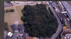
牧野車塚古墳(国史跡) 4世紀後半築造と考えられる全長107.5mの前方後円墳。