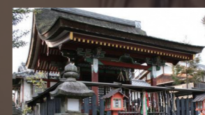
巖島神社 末社春日神社本殿(重要文化財) 一間社流造、檜皮葺で、室町時代中期の建築と考えられます。