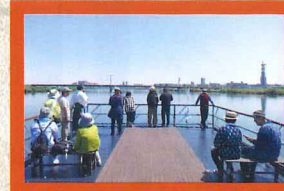
船上デッキでは、淀川の景色を一望できます。