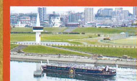
河川敷にある白い塔が目印!