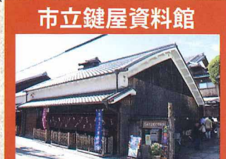
乗船特典: 入館券付き(無料)