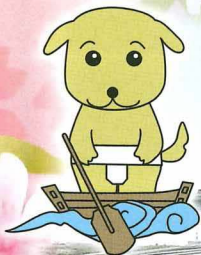
ひらかた観光大使の「くわんこ」