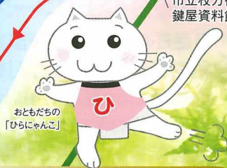
おとだちの「ひらちゃん」