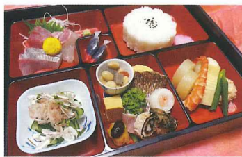
季節の御膳(イメージ)

月曜日の上りコース限定で、 割烹藤の「季節の御膳」を鍵屋資料館の 大広間でお召上がりいただける、 特別体験のオプションプランをご用意しました。 追加料金3,000円でお申し込みいただけます。 3日前までにお申し込みください。