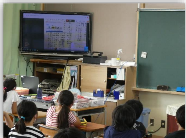
1組の発表を見る2組の児童