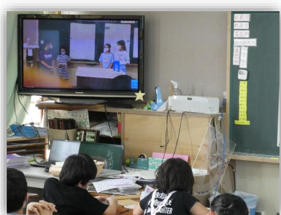
2組の発表を見る1組の児童