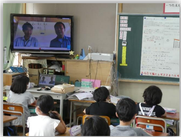
減量業務室の方のお話を聞いている児童