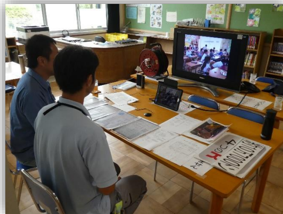
児童に向けてお話し中の減量業務室の方