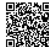
《今日の給食(山田中)》