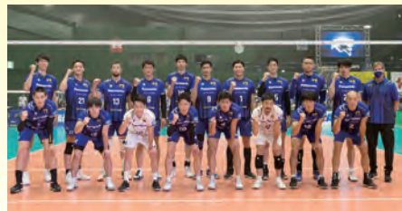
パナソニックパンサーズ(2020-21シーズン) バレーボールチーム