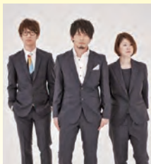
アンダーグラフ ミュージシャン