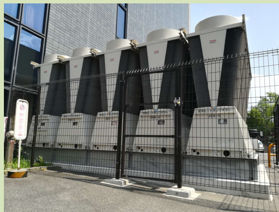
空調用熱源機（きらら）

各諸室の空調に使用する冷温水をつくる機器で以前のものより省エネ効果を高めています。