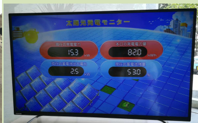
発電量モニター（きららエントランス）

省エネ効果に加え、災害時の非常用電源としても使用できます。昼間発電した電気を蓄電池に溜めることで、夜間でも使用することができます。