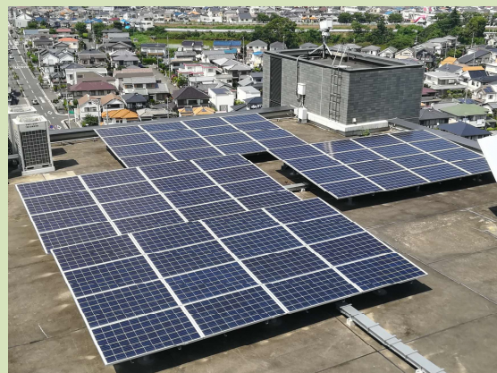
太陽光パネル 21.2kw（きらら屋上）

省エネ効果に加え、災害時の非常用電源としても使用できます。昼間発電した電気を蓄電池に溜めることで、夜間でも使用することができます。