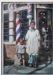
写真提供：源井徳三 カラー化：「記憶の解凍」プロジェクト 庭田杏珠×渡邊英徳

AI(人工知能)と当事者への取材や資料などを元にカラー化した戦前・戦争の写真約20点を展示。平和がテーマのアニメ映画の上映も。点訳資料あり。▶期間など 7月31日(土)～8月12日(休)午前9時30分～午後7時、中央図書館。無料。当日直接会場へ。