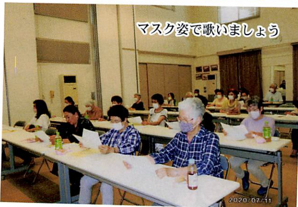
マスク姿で歌いましょう