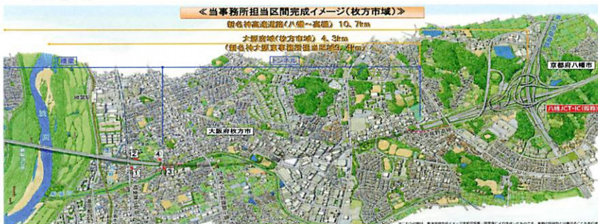
(NEXCO西日本のHPより抜粋)

新名神高速は、名神高速等と交通機能を補完することにより、高速道路ネットワークに求められる〔高速性〕〔定時性〕〔快適性〕〔安全性〕などの機能を高めるとともに、沿道及び西日本の国民生活産業の更なる発展に寄与することを目指しています。