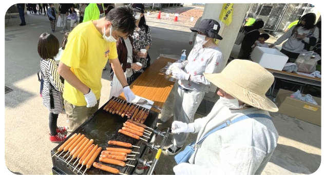
フランクフルトの売店