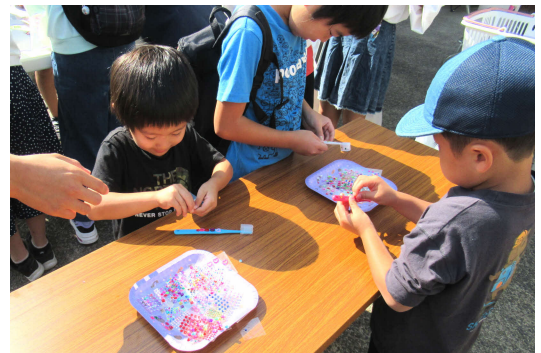
てらしま歯科による歯ブラシデコレーション