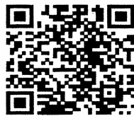
▲このQRコードでヤマガラの地鳴きの声が聴けます。