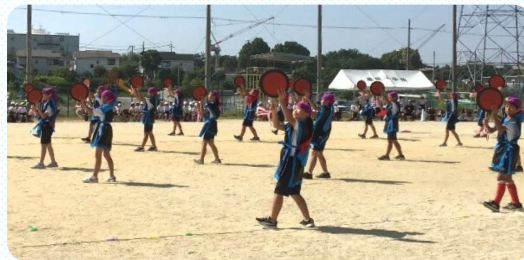
5年「ピースクルエイサー」