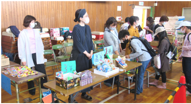
おもちのあてものコーナーも人気