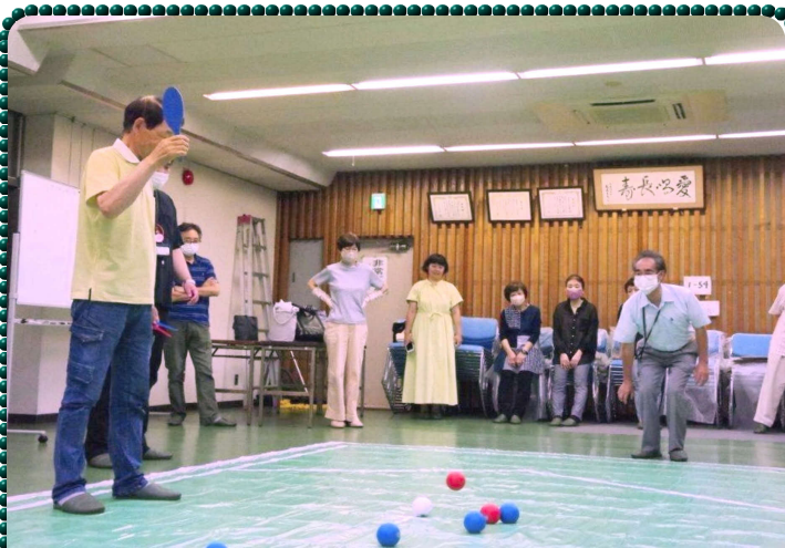
藤阪公民館で校区福祉委員会もボッチャを学習