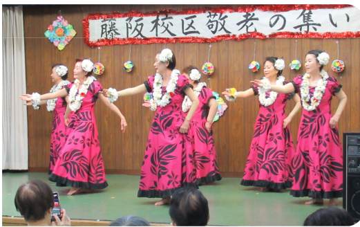
愛逢フラガール フラダンス