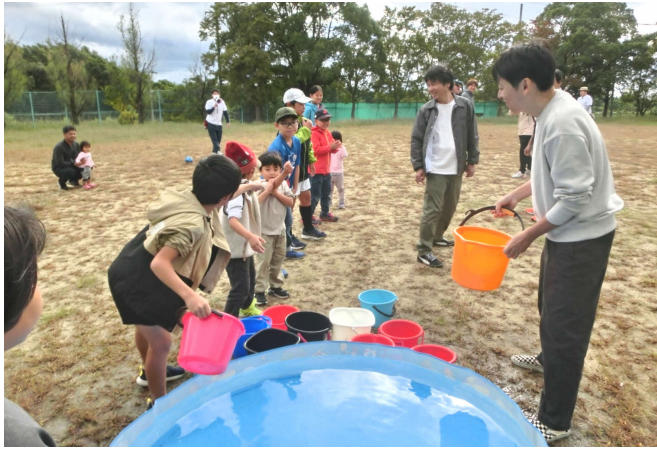
バケツリレーによる消火訓練

午前中は、救急救命講習 と水消火器を使用した消火 訓練を行い、備蓄食品 (アルファ化米炊き込 みご飯) 試食や豚汁な どの炊き出しの昼食を 挟んで、午後からはバ