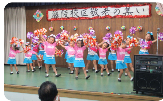
JOYチアリーダーズクラブ チアダンス