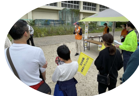
田口山校区自主防から受け入れの説明

いるものの、低地にあるために、枚方市防災ガイド「穂谷川洪水ハザードマップ」では豪雨時に浸水被害に遭う危険性があるとされて