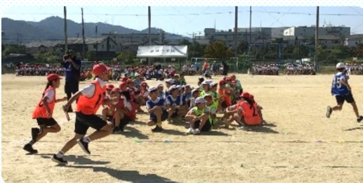
4年「走れ・つなげ・その先へ 74人の全カリレー」