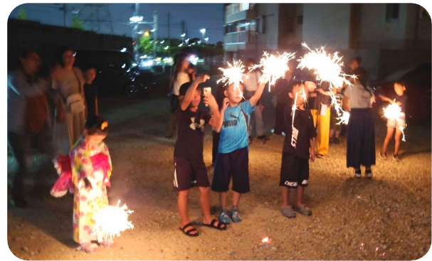
リバーサイド南の夏祭り、 子どもたちも花火で楽しく

藤阪区秋祭り 子ども神輿は なかったけれど 神社での神輿(みこし) の展示と法被を貸与しての 神輿との記念撮影会を、婦 人会、秋祭り実行委員会、 菅原神社の協力のもと、10 月15日(日)に開催しまし た。