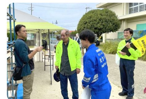
市災害対策本部長の伏見市長と通信