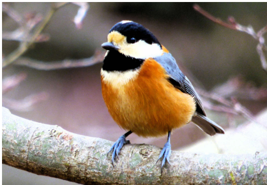
山田池公園のヤマガラも人懐っこい