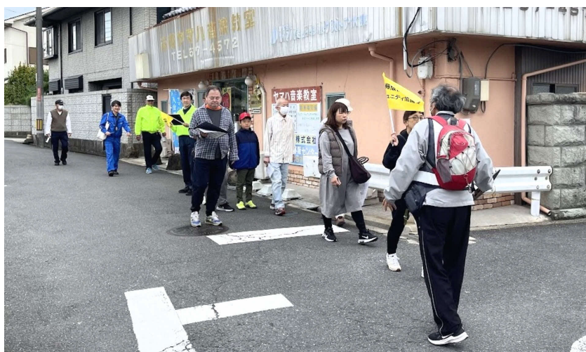
藤小から田口山小まで3コースで歩いて避難路の安全をチェック