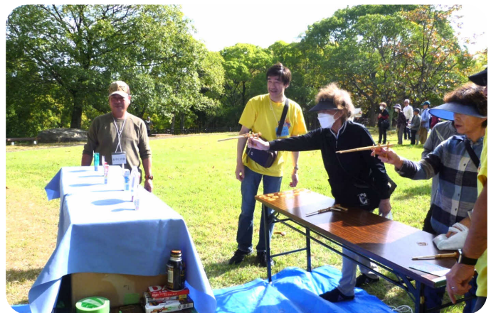
スタンプラリーゲームで楽しく交流「輪ゴム鉄砲」

ツ自治会は、山田池公園で スタンプラリーと公園散策 の催しを開催しました。こ れは子どもとその保護者や 高齢者の方たちが山田池公 園に設けた幾つかのゲーム ポイントと一緒に回り、ゲー ム係の人たちとも談笑しな がら次々とゲームに挑戦し て行くことによつて、お互 いに交流を深めて貰えるよ うに企画したものです。 藤阪ハイツ敷地外では久