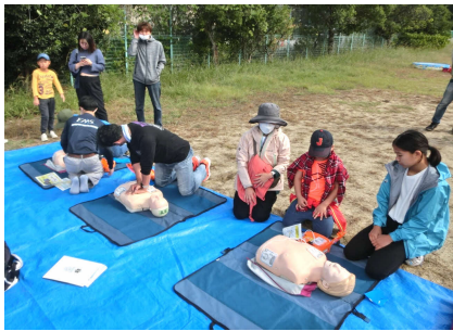
いざというときに救急救命講習

ケツリレーによる消火訓練、 電気やガスが使えない場合 を想定した火起こし体験を 行いました。救急救命講習 や消火訓練では、この自治 会で育った消防員が指導役 となつて、子どもから大人 までわかりやすい説明を受 け、心肺蘇生法(心臓マッ サージ、AEDの使い方) も学びました。