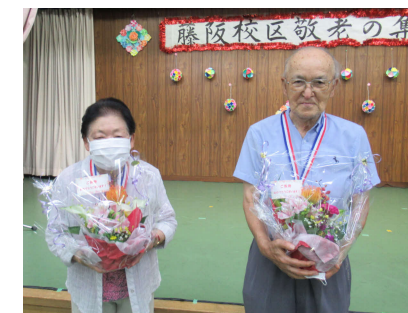
盛り花とメダルでご長寿をお祝い