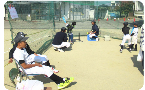
ティーバッティング