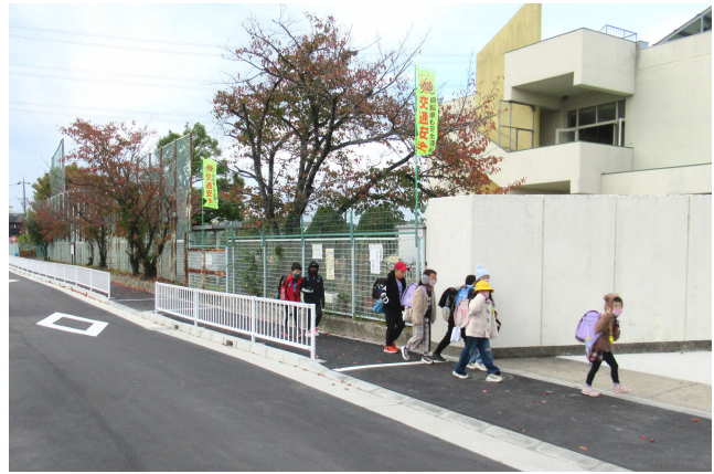
校庭東側の通学路、フェンスができて安全に