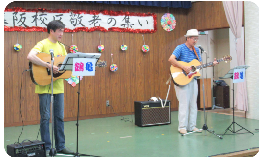
ご長寿お祝いバンド鶴亀