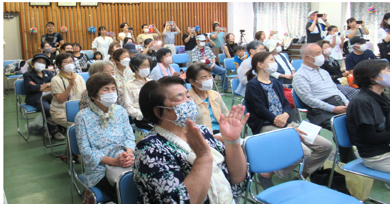
皆さんの心を込めた熱演に、会場いっばいに笑い声と拍手が広がりました