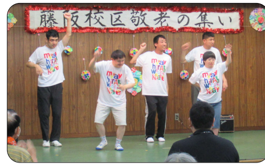
ワーク草笛 ダンス

11月23日(木)に行われた枚方社協の第2回ボッチャ大会で、藤阪校区チームが出場12チーム中、みごと準優勝という成績を収めました。