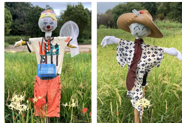
今年もしっかり登場しました

昨秋の当紙98号で紹介した山田池公園の田んぼのかかし。今年も6体の創作かかしが、しっかりと稲を守っていました。