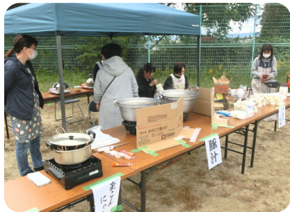
アルファ化米や豚汁など炊き出し訓練