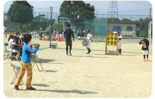
ストラックアウト