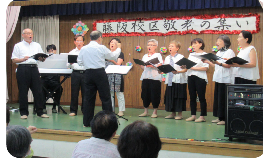
わいわいエチュード コーラス