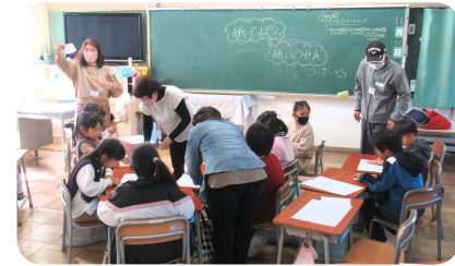
紙てっぼう・紙ふうせん

子どもたちと昔ながらの遊びやモノづくりを通じてふれあう世代間交流。11月22日(水)4年ぶりに藤阪小学校で開催しました。 今回は1年生と2年生の児童が、校区福祉委員会、民生児童委員、藤阪区役員、 学校評議員、ボランティアグループ「ひまわり会」の皆さんの手ほどきを受け、教室と体育館で紙トンボやあやとり、紙てっぼう、紙ふうせん、リボン結びと縄結び、パックぽっくり、おこま回し、けん玉を 楽しく体験しました。子どもたちは「けん玉むずかしい」「紙てっぼうは音が出て面白い」などと言いながら、元気よく次々に遊びをこなし、あつという間の1時間半でした。