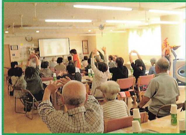
落合先生のご指導