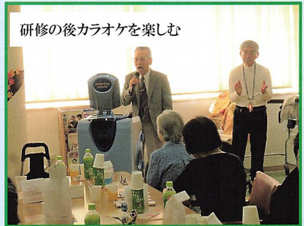
研修の後カラオケを楽しむ

新年度につきましては、これまで通り充実した企画の下、頑張っていけますのでご参加ください。