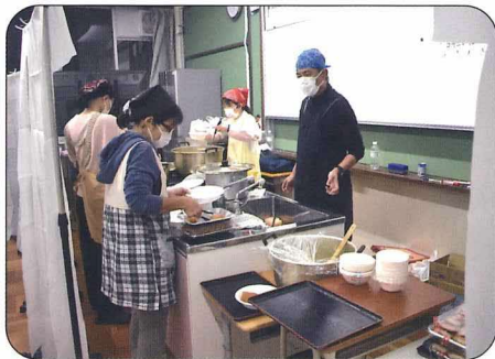
スタッフの皆さん