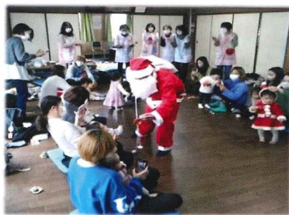
クリスマスプレゼント子育てサロンより

令和4年度校区福祉活動は「コロナに対する警戒は必要ですが、正しい情報を収集し、これから想定されるウイズコロナ（コロナと共存）の時代を、工夫しながら乗り越え活動計画に基づき実践」