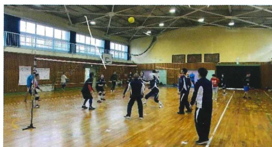
<第34回ソフトバレーボール大会>

令和5年2月19日には、体振主催の「第34回ソフトバレーボール大会」も3年振りに開催いたしました。定員30名で感染対策を講じ、毎週金曜のソフトバレーボール練習に来て下さっている方を中心に、久しぶりに白熱し