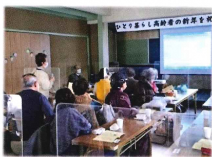
令和5年 一人暮らし高齢者新年を祝う集いより