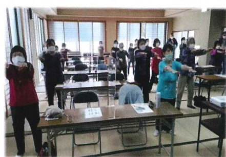
枚方体操で体をほぐす皆さんいきいきサロンサロンより

と明確にしスタート致しました。いこいの広場、いきいきサロン、子育てサロンは参加者制限等しながら計画通り実施。また、恒例のレッツゴーウォーキングは今年も天候に恵まれ多数参加いただき行いました。その他、「一人暮らし高齢者の新年を祝う集い」はコロナ感染防止対策として北、南地区での分散開催を昨年に引き続き企画しました。昨年はオミクロン感染拡大第6波突入で中止を余儀なくされましたが、今年3年ぶり規模縮小しながらも行い、参加者皆さんからは「開催いただきありがとうございます」と異口同音に感謝の声をいただき、皆さんがいかに心待ちされていたかを実感致しました。今後は、「速やかにコロナ禍以前の活動に戻していく事」を目指します。今後ともご指導ご鞭撻のほど宜しくお願い致します。