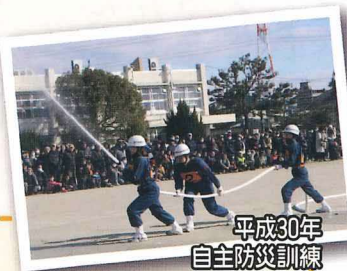
平成30年 自主防災訓練