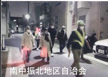
南中振北地区自治会