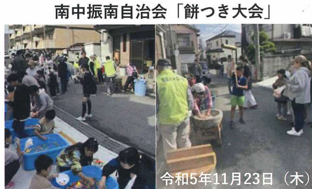
南中振南自治会「餅つき大会」

昨年11月12日(日)の午前中、南中振公園で南中振北地区自治会と北中振中央自治会そして北中振西自治会との合同防災訓練を開催しました。時々小雨と少し寒い中でしたが、有意義な訓練を行うことが出来ました。訓練は枚方消防署中振出張所から7名の職員に来て頂いて、初期消火の対策と水消火器を使用した初期消火訓練を指導して頂きました。AEDを使用している訓練では機材と留意事項の説明の後、皆様に体験して頂きました。特に強調されていたのは、行動する「勇気」が大事だということです。参加して頂いた皆様、長い時間有難うございました。