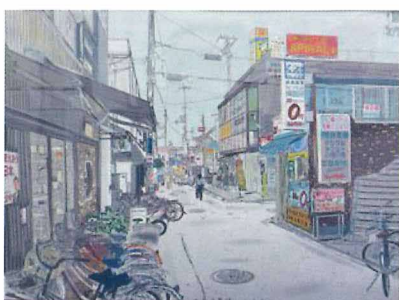
平成22年の風景（ともだクリニック様ご提供）