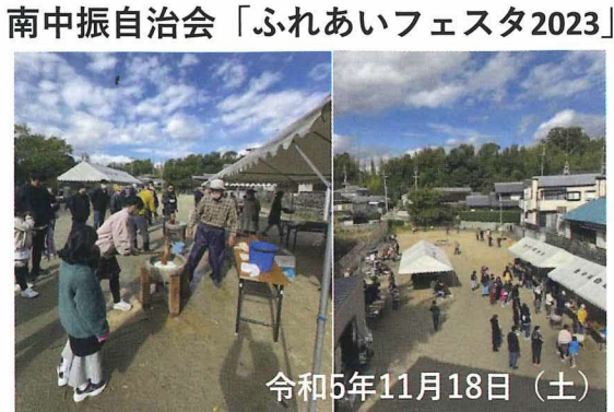
南中振自治会「ふれあいフェスタ2023」