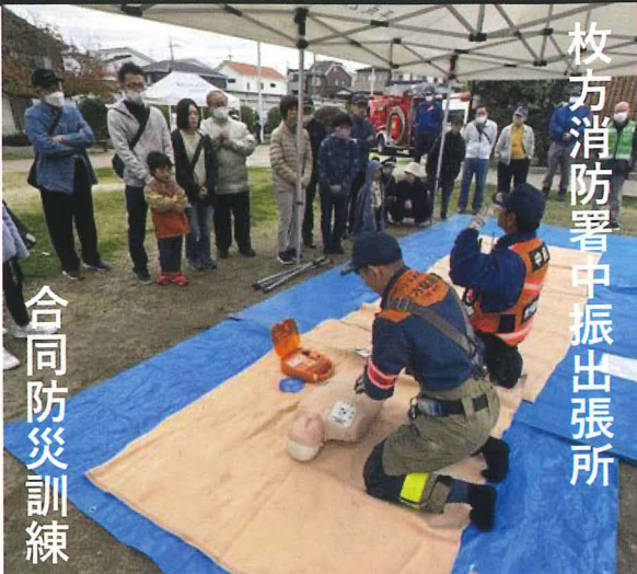
枚方消防署中振出張所 合同防災訓練