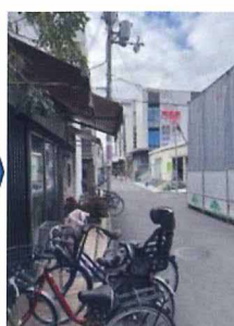
令和6年1月（現在）の風景