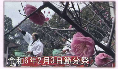
令和6年2月3日節分祭