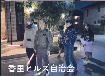
香里ヒルズ自治会