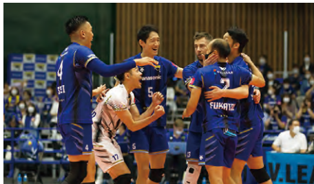
📞スポーツ振興課 ☎841・1412、☎841・1278

Vリーグの強豪で市PR大使・パナソニックパンサーズの枚方でのホームゲームに招待。大分三好ヴァイセアドラーとの迫力あるバレーボールの試合を観戦できるチャンスです。▶日時など 1月15日(土)・16日(日)午後2時、パナソニックアリーナ。無料。▶申込 12月1日正午～12日にパナソニックパンサーズのホームページ(🌐https://panasonic.co.jp/sports/volleyball/)から専用フォームでパナソニックパンサーズへ(1人4枚まで)。抽選で各400人。インターネット環境がない人はスポーツ振興課へお問い合わせを。