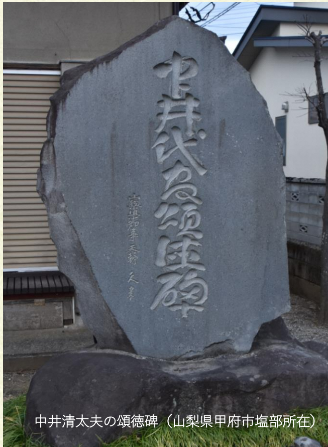
中井清太夫の頌徳碑（山梨県甲府市塩部所在）