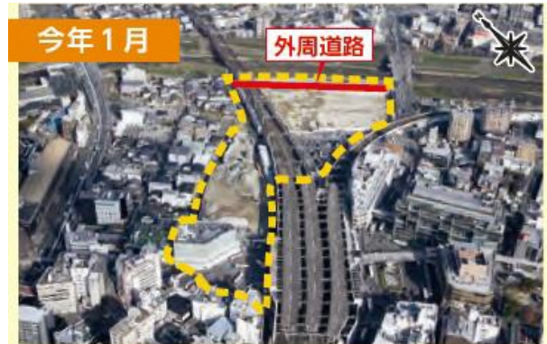
▲既存施設が解体され、これから新築工事が始まります。