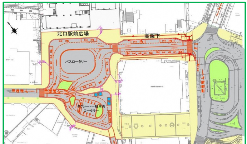
▲枚方市駅北口駅前の平面計画図

ロータリー拡充や高架下の一般車両の流入抑制で交通導線を改善し、便利で安全な駅前広場に。