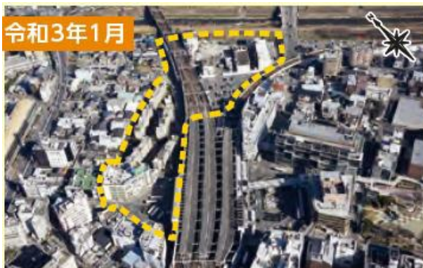
▲中央に見える京阪本線と交野線に挟まれたエリアに駅直結の複合施設が整備される予定です。