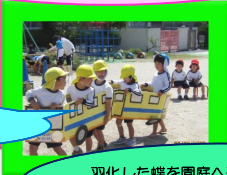
バスが出発しま〜す！