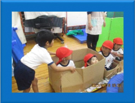
すみれ組さんのあそび場 にはホテルもあったよ！

4・5 歳児で山田池公園へ行き、遊具で遊んだ後、幼稚園の遊戯室で5歳児すみれ組さんが楽しいあそび場を作ってくれました。山田池公園には一緒に行けなかった3歳児さんも招待してもらい、いっぱい遊びました。