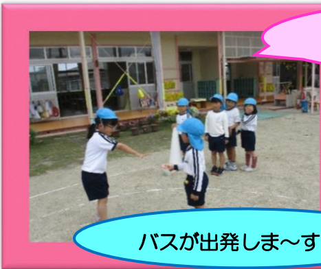
友達と一緒に遊ぶのが楽しい！

戸外で遊ぶのが心地よい5月。園庭や園外へも出かけ、いろいろな遊びを楽しみました。4月に入園した子ども達も園生活に慣れ、同じクラスや異年齢の友達と関わることが楽しくなってきました。