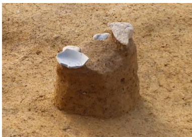
（中央写真：奈良時代の須恵器）（右写真：古代の柱穴）