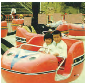
▼ひらかたパークで弟と (写真右・小学2年生)。