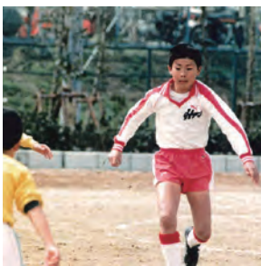
▲枚方FC時代、春休みの 試合 (小学6年生)。