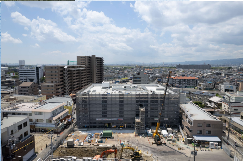
光善寺駅西地区 第一種市街地再開発事業