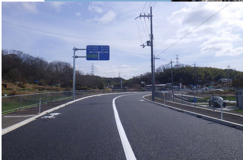
都市計画道路「長尾杉線」