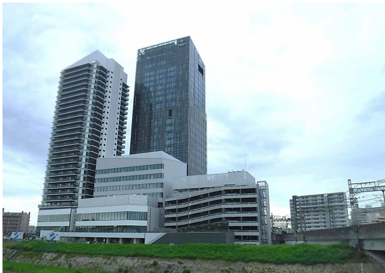
枚方市駅周辺地区 第一種市街地再開発事業