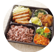
販売などの詳細はP.20参照

このメニューは「ひらかた食育カーニバル」で京阪百貨店枚方店とのコラボ弁当としても販売されます。1日に取りたい野菜の約2分の1を取ることができる副菜4品とメインディッシュの宮崎県産豚肉「高城の里」のトンカツ、市の郷土料理くすみもちも入った限定商品をぜひご賞味ください!