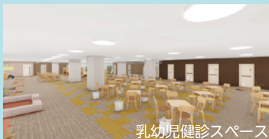
乳幼児健診スペース

母子保健課と子どもの育ち見守り室(となとな)を統合し「まるっとこどもセンター」を開設。妊娠届出や乳幼児健診、妊娠出産、子育て、友だち・家族のことなどおむね18歳までの各種相談やアウトリーチ(家庭訪問)による支援をします(9月の移転までは現在の場所で業務を実施)。