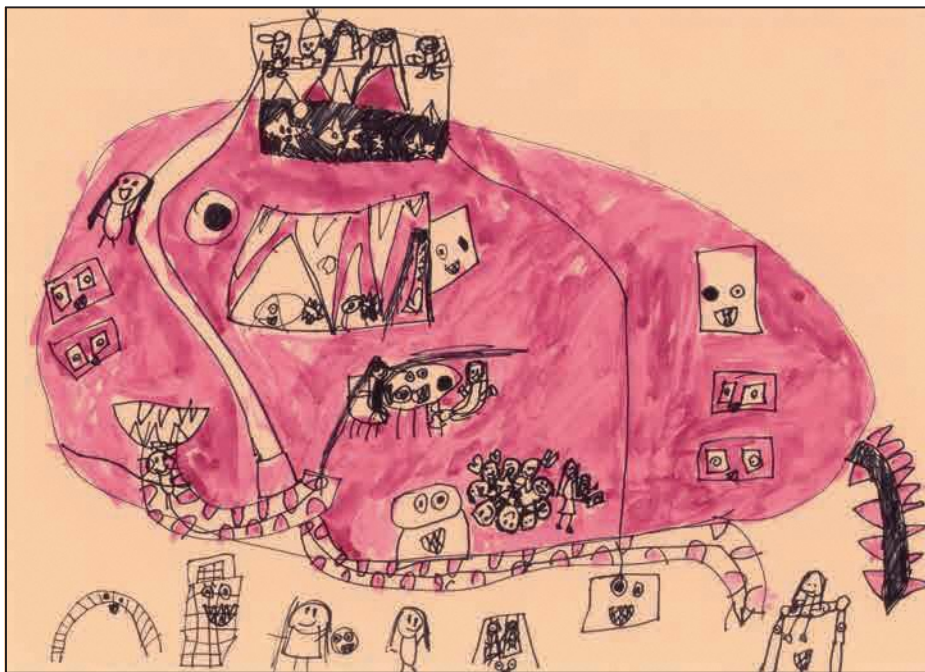
市内保育所（園）に通う5歳児の絵