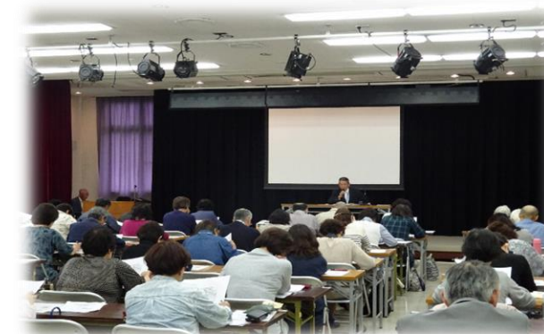
枚方市生活支援員養成研修の様子

❖申込受付期間❖令和6年12月19日(木)~令和7年1月8日(水) 先着30名 ※ ☎での受付は平日の9:00~17:00、faxは24時間受付可 (faxは研修名・住所・ふりがな付き氏名・生年月日・年齢を明記)